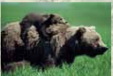
カトマイ国立公園